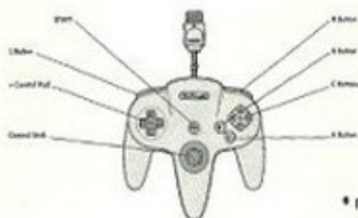
Back of Controller